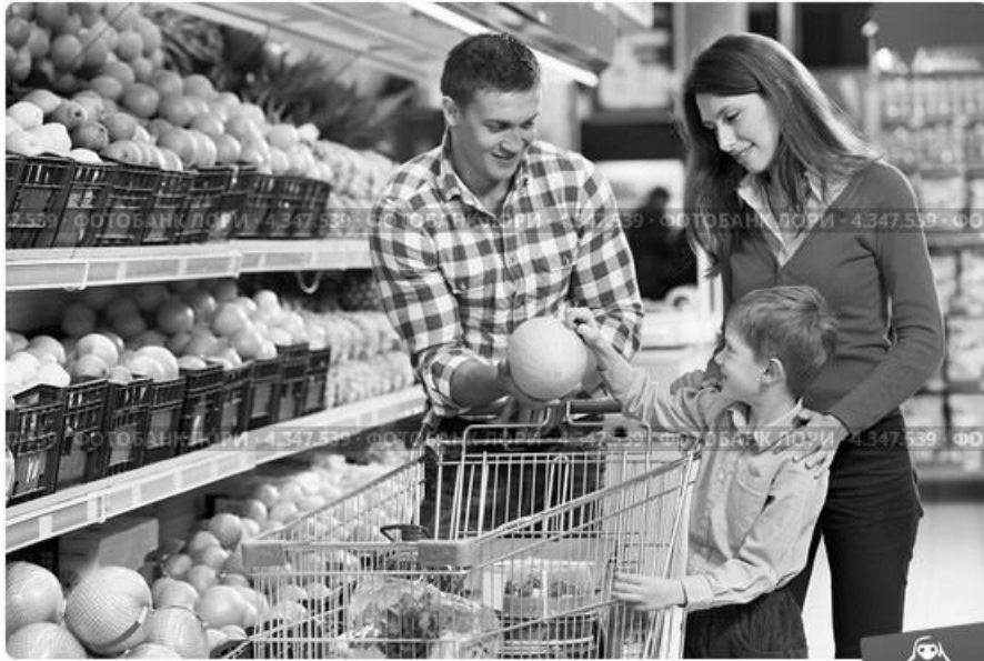
Семья выбирает продукты в супермаркете